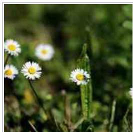
OROBIE, la mia 500^ galleria