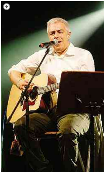
Davide Van De Sfroos

17 luglio 2014 | Cultura e Spettacoli | Commenta