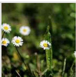
OROBIE, la mia 500^ galleria