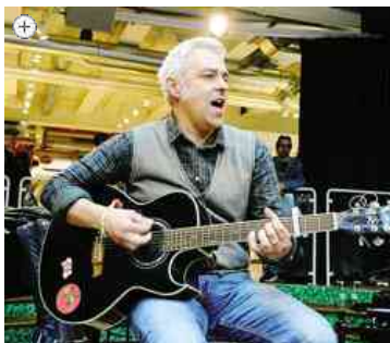
Davide Van De Sfroos si esibirà domani sera al museo della seta di Garlate

17 luglio 2014 | Cultura e Spettacoli | Commenta